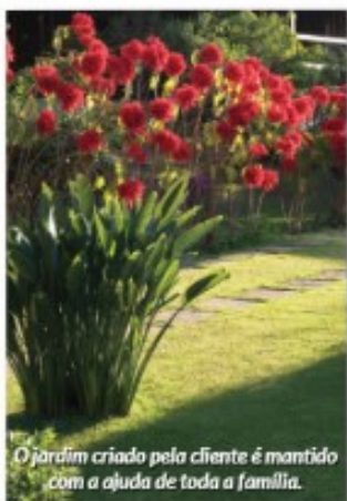
O jardim criado pela cliente é mantido com a ajuda de toda a família.

existiu. Acontece que depois do recolhimento pelo qual todos passamos, o que era experiência se tornou rotina. Todos os testes foram feitos em ocasiões diferentes essa casa passou a ser o porto seguro de todos. Almoços intermináveis nos fins de semana se estendem até tarde da noite e as pessoas circulam entre os espaços usufruindo do charme e do conforto desde os jardins até as suítes de hóspedes. O compartilhamento desses espaços