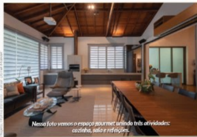
Nessa foto vemos o espaço gourmet unindo três atividades: cozinha, sala e refeições.