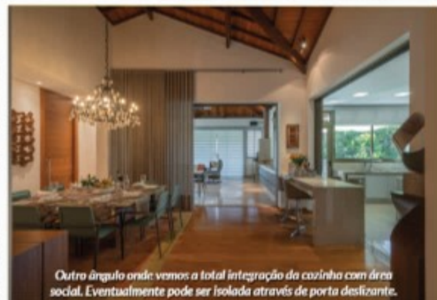
Outro ângulo onde vemos a total integração da cozinha com área social. Eventualmente pode ser isolada através de porta deslizante.