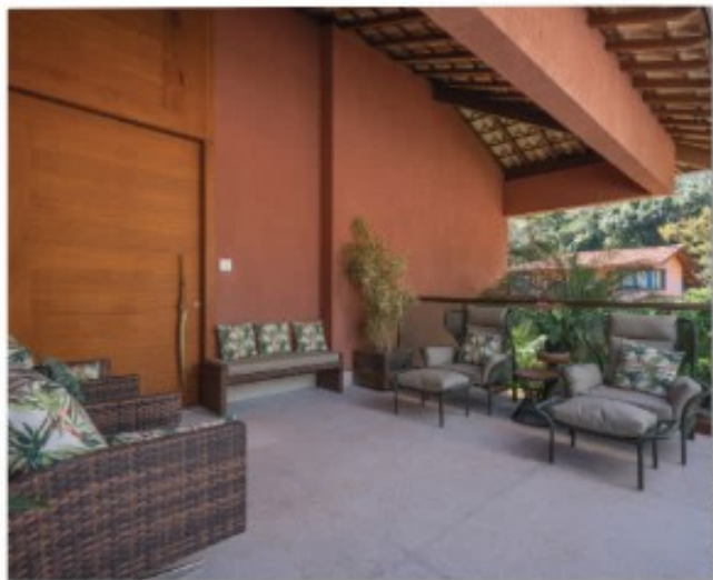
Projeto: Myrna Porcero

Trazemos nessa matéria uma casa que projetamos para uma família que ama compartilhar seu espaço com amigos e familiares. Já é o terceiro projeto para os mesmos clientes e esse hábito sempre