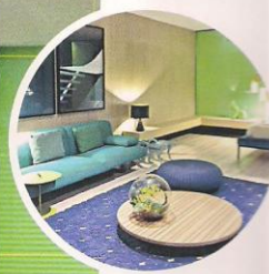
Com foco nas cores, Brunete optou pelo exclusivo tom Acqua Fraccaroli, desenvolvido na Espanha, para compor o ambiente