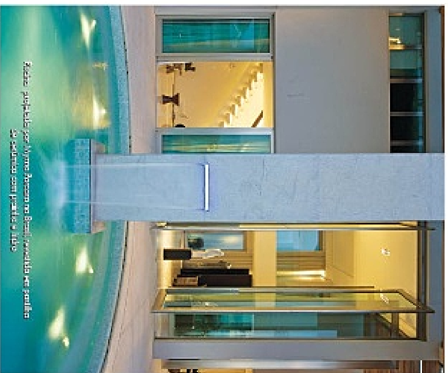
Área equipada por Álvaro Bragosa no Brasil, revestida em pedrinhas de pedras com pedras e vidro

O verão chegou e a Flórida é um dos locais do mundo onde a energia é mais contagiada. As altas temperaturas provocam o efeito sauna, desde que estaguardos ao ar livre, e as horas de lazer exigem muito mais refrescos.