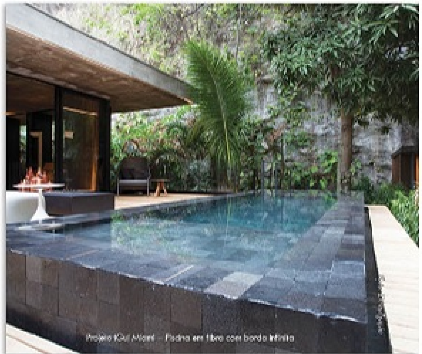
Projeto IGuí Miami – Piscina em fibra com bordo infinito

As piscinas de concreto no Brasil geralmente são revestidas em porcelana ou pedra integralmente. Na Flórida recebem uma manta chamada Diamond Bright na região onde fica a água, deixando o revestimento de pastilhas nas áreas externas. São tratadas com cloro e ácido muriático.